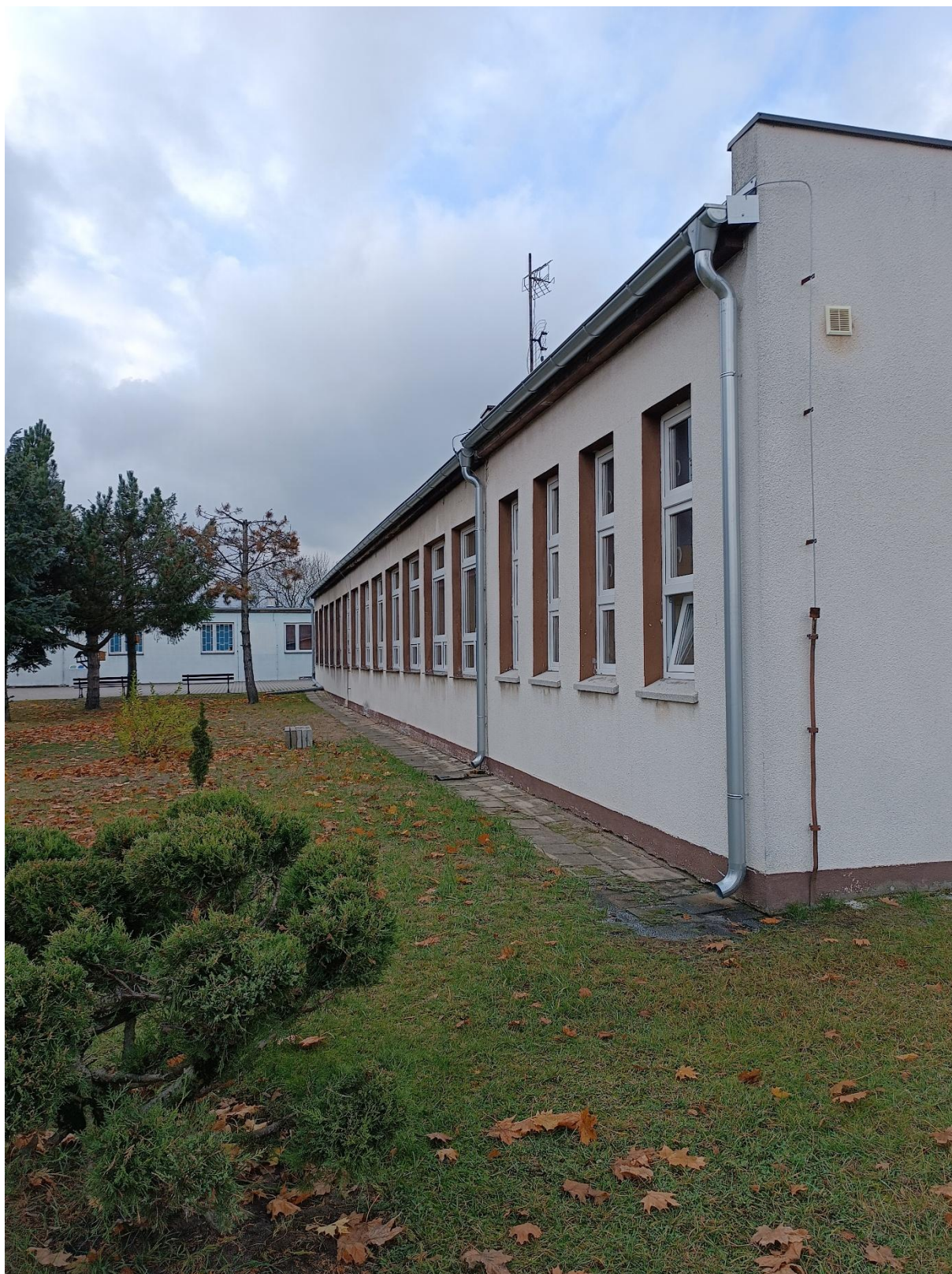
Rysunek 11 Widok budynku od strony południowej