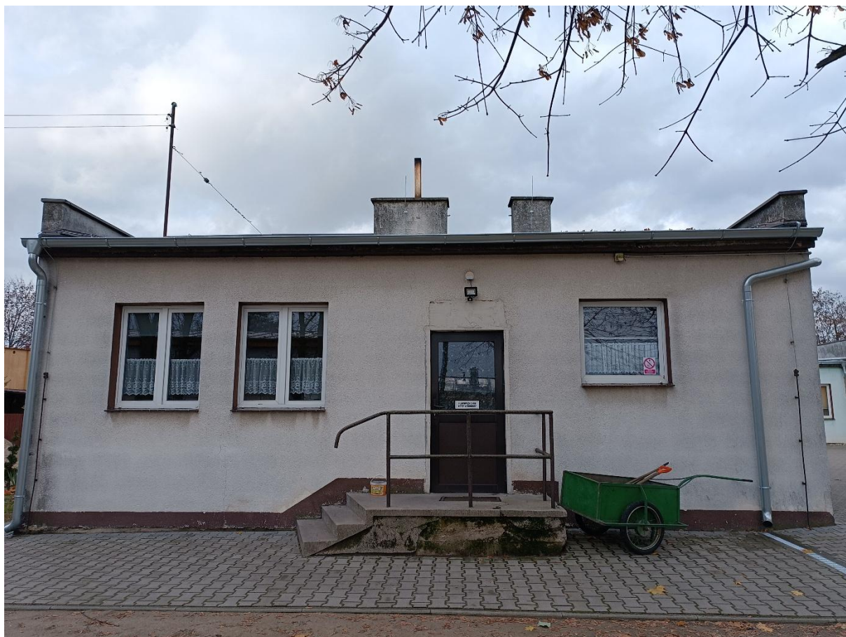
Rysunek 13 Widok budynku od strony południowej