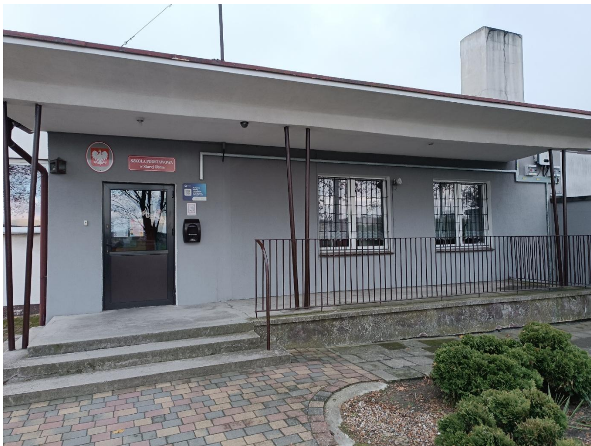
Rysunek 5 Widok budynku od strony północnej