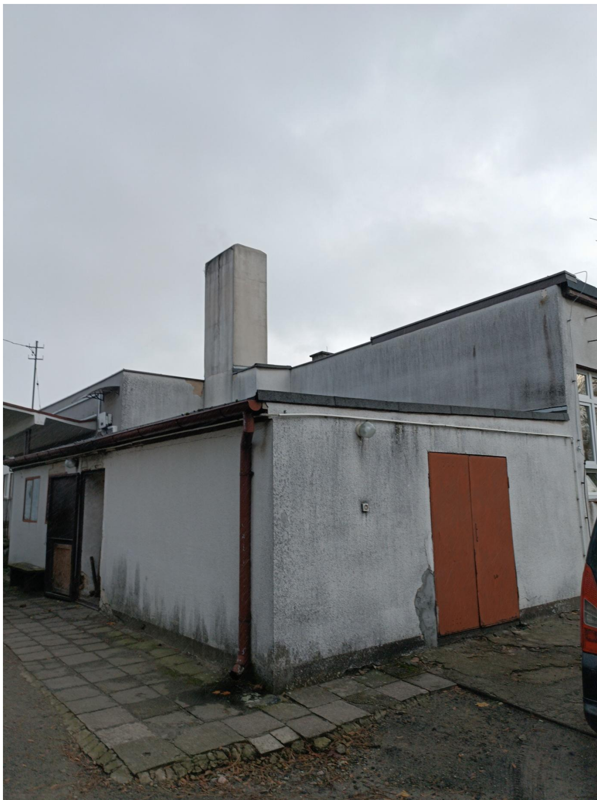
Rysunek 7 Widok budynku od strony zachodniej