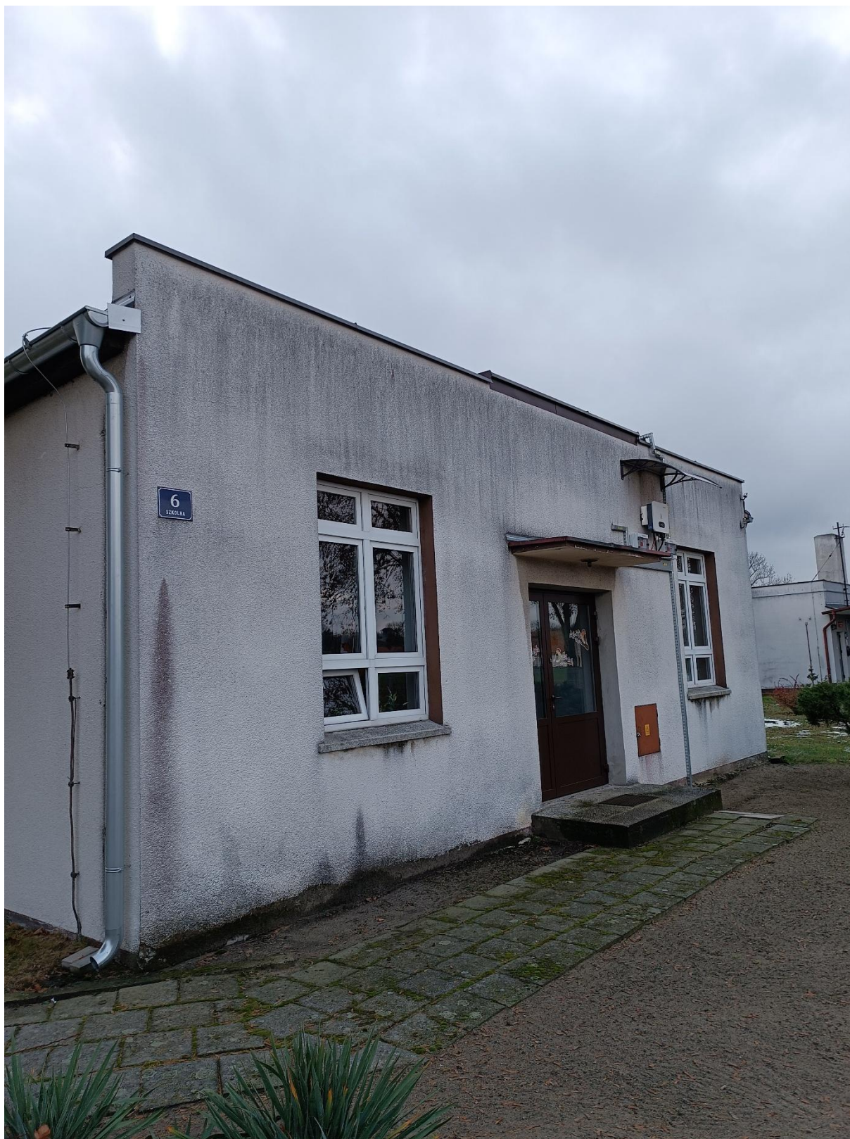
Rysunek 2 Widok budynku od strony północnej