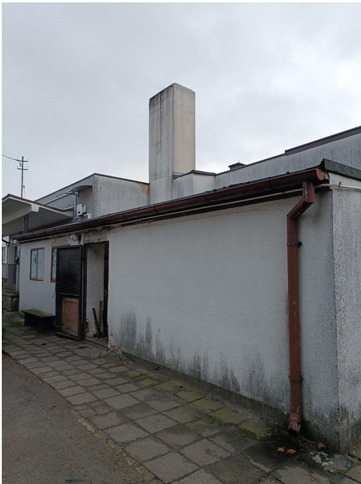
Rysunek 6 Widok budynku od strony północnej