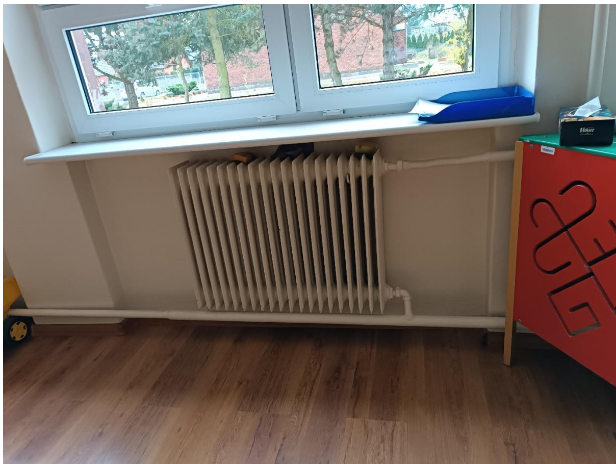
Rysunek 17 Widok przykładowego grzejnika zastosowanego w budynku