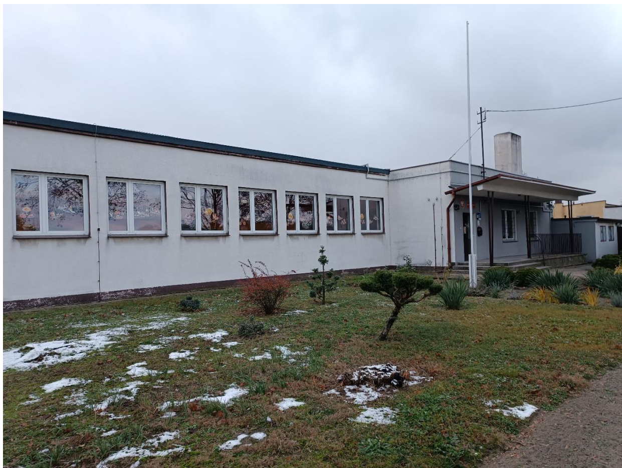
Rysunek 4 Widok budynku od strony północnej