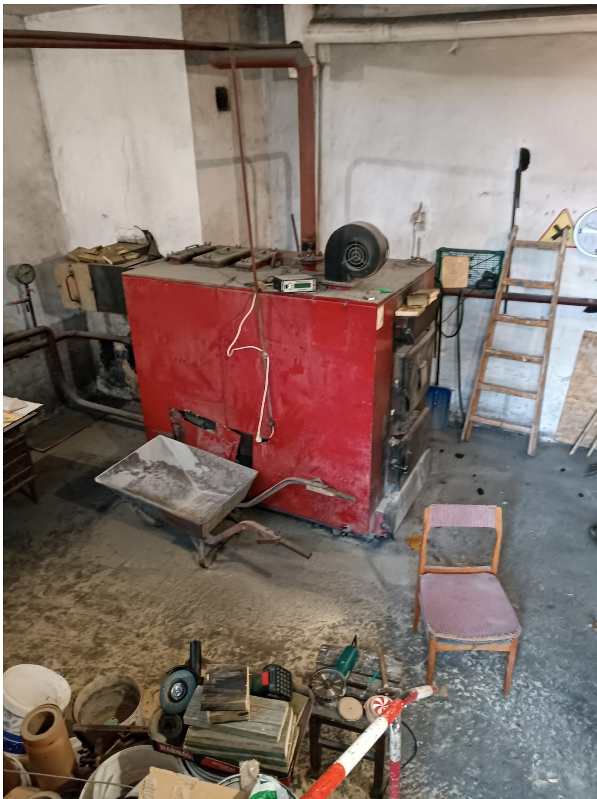
Rysunek 14 Widok kotła węglowego