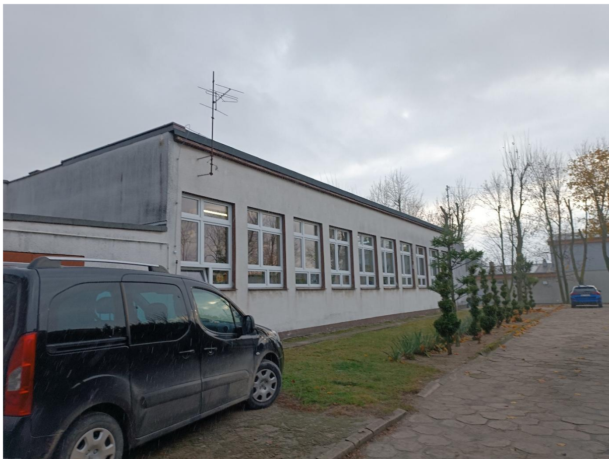
Rysunek 8 Widok budynku od strony zachodniej