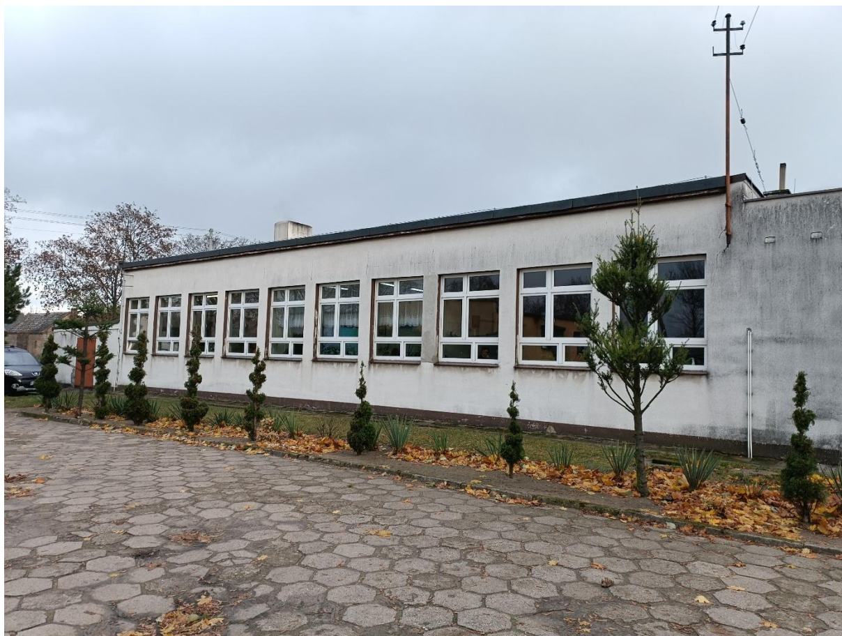
Rysunek 9 Widok budynku od strony zachodniej