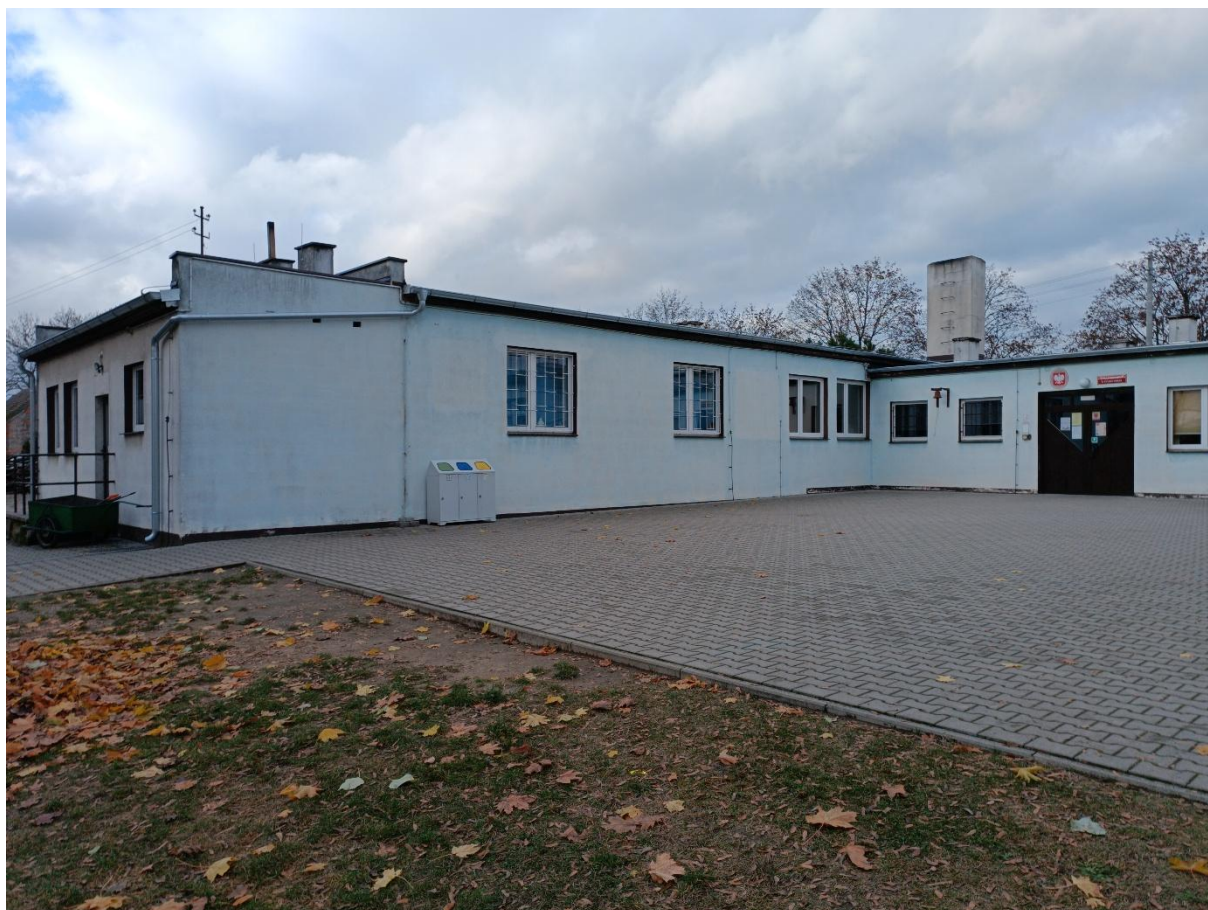
Rysunek 12 Widok budynku od strony południowo-wschodniej