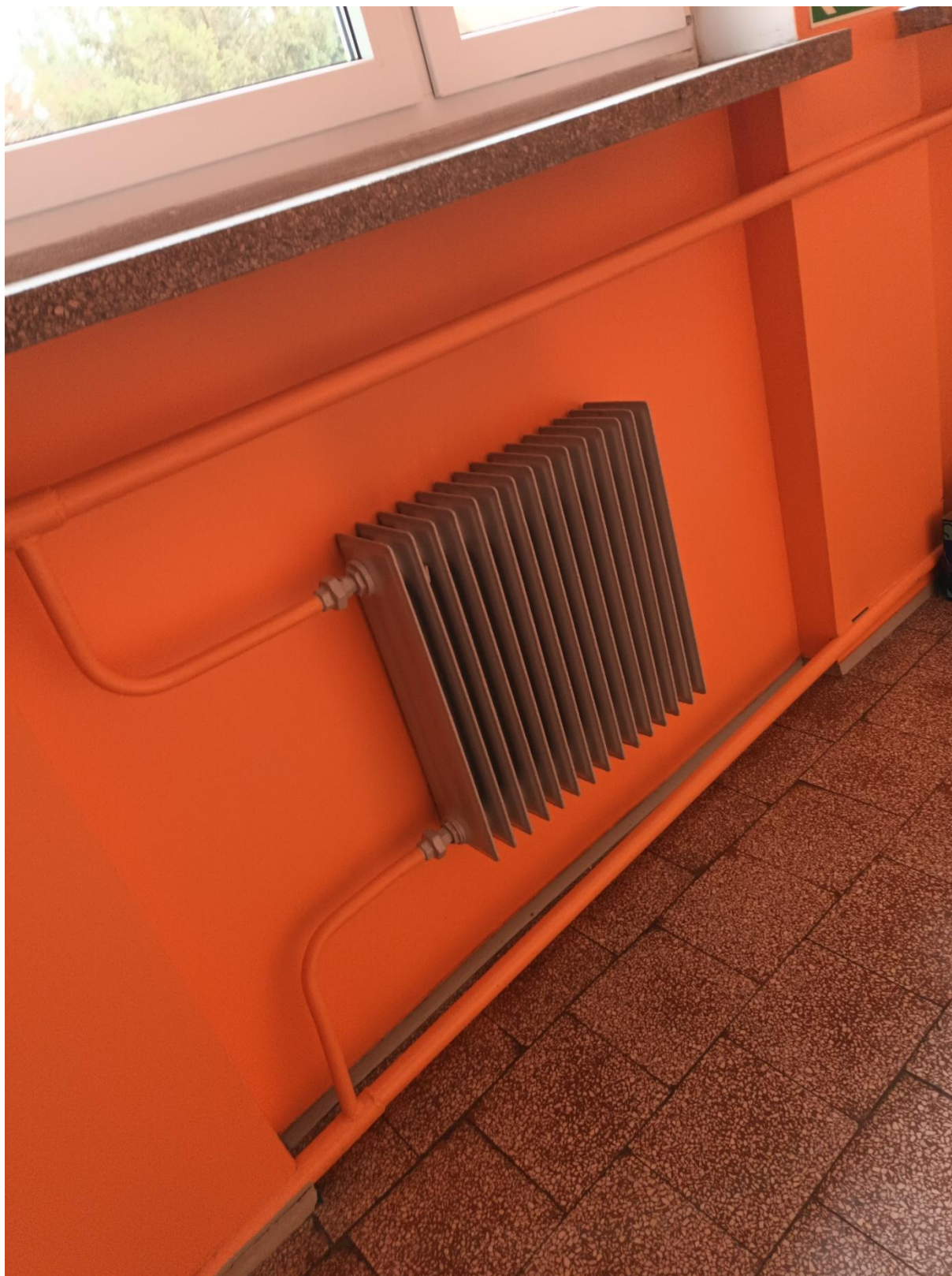
Rysunek 16 Widok przykładowego grzejnika zastosowanego w budynku