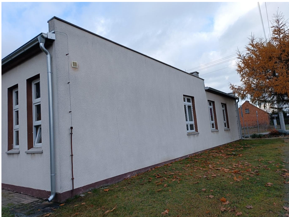
Rysunek 10 Widok budynku od strony wschodniej