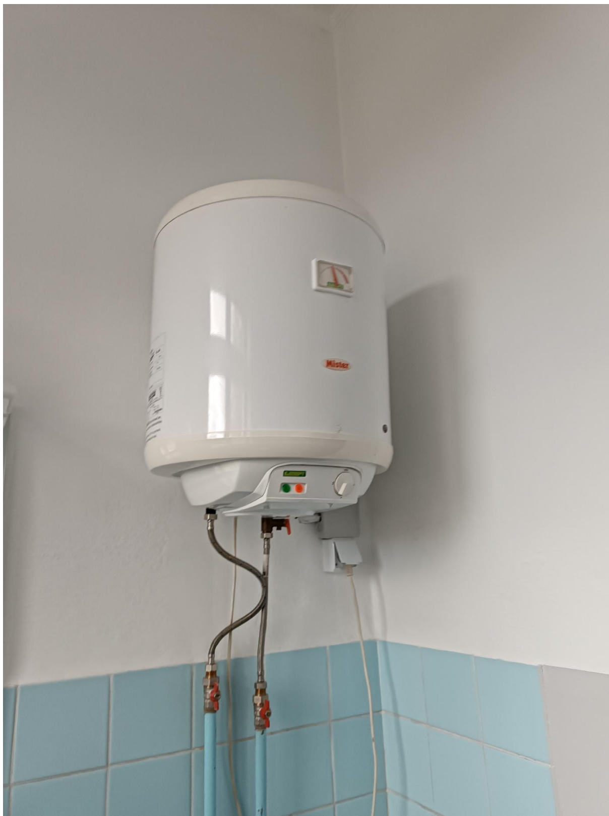
Rysunek 18 Widok elektrycznego podgrzewacza zastosowanego w budynku