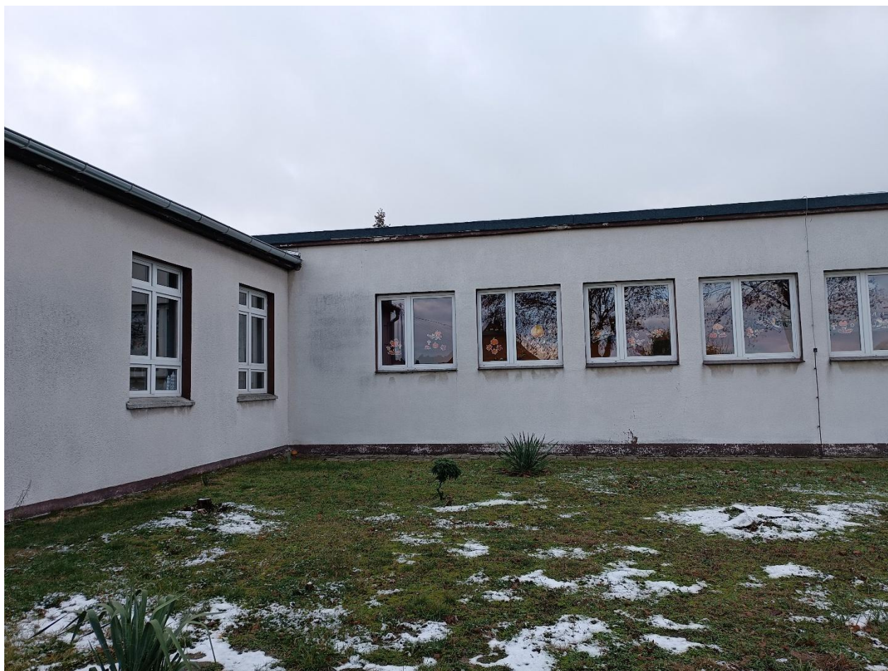
Rysunek 3 Widok budynku od strony północnej