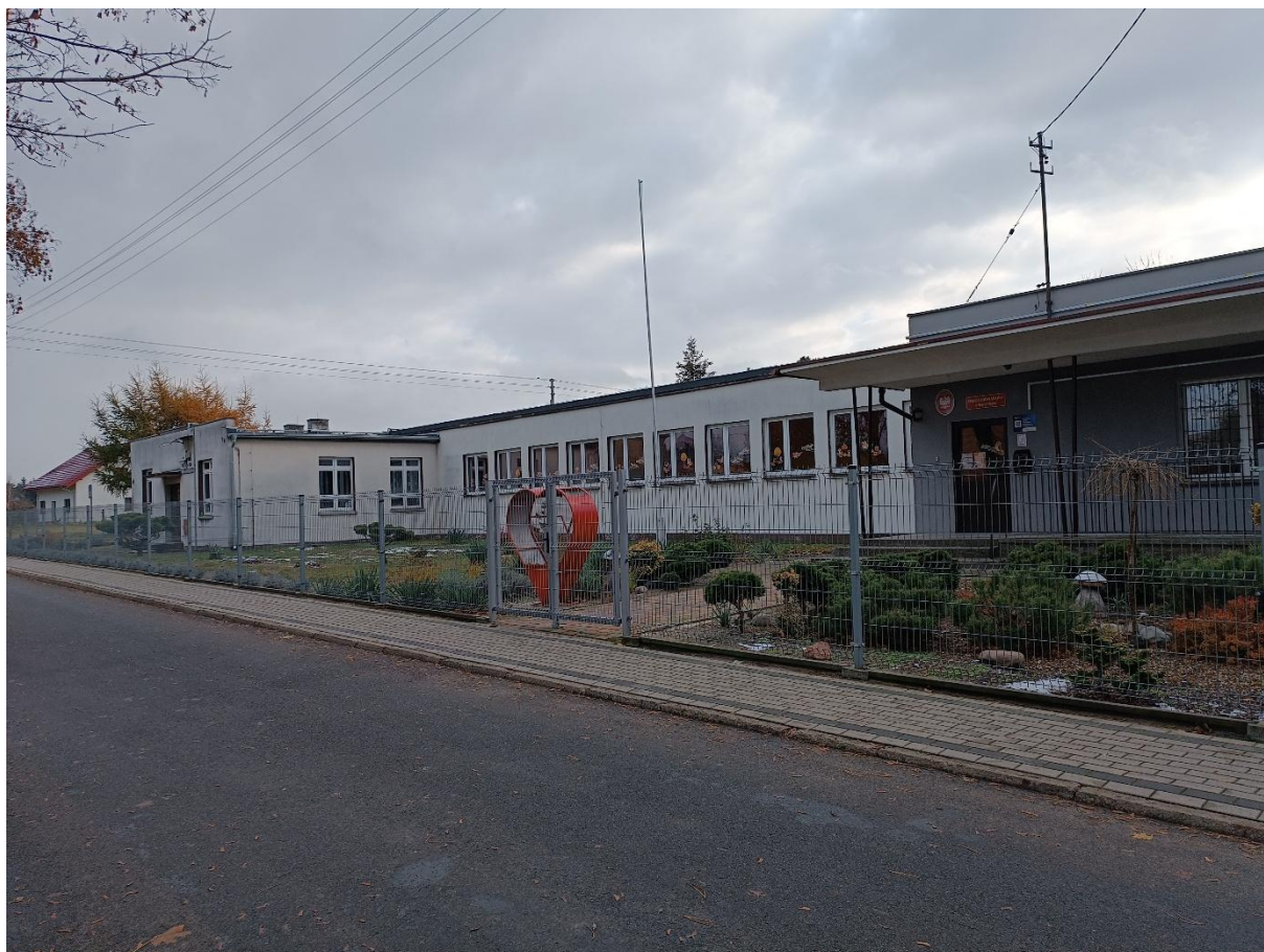
Rysunek 1 Widok budynku od strony północnej