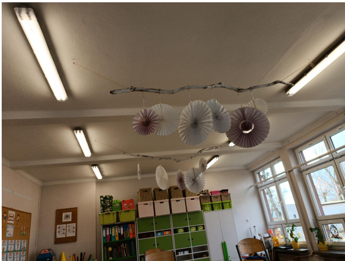
Rysunek 19 Widok przykładowej instalacji oświetleniowej zastosowanej w budynku